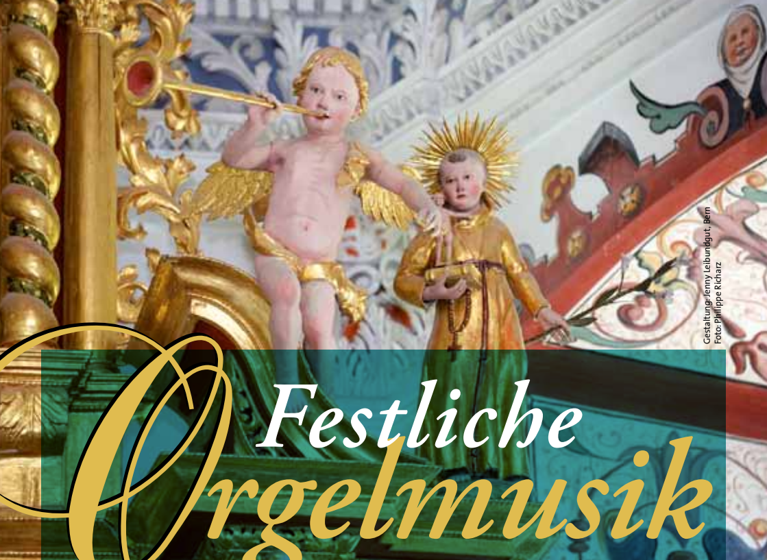
Gestaltung: Jemy Leibundgut, Bern