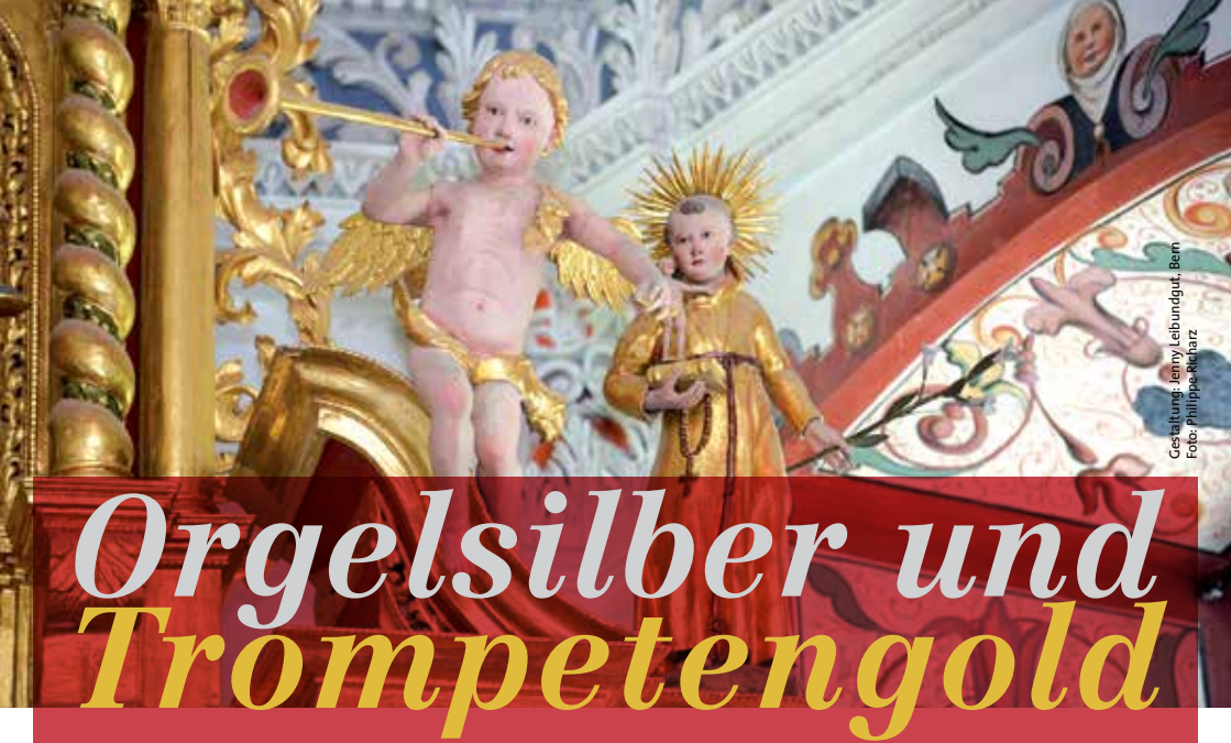
Gestaltung: Emmy Leibundgut, Bern